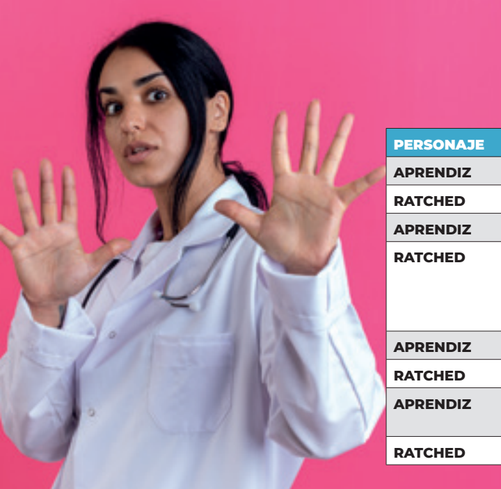
Tabla 3. personaje y guion en la serie “Ratched” (capítulo uno de la primera temporada)